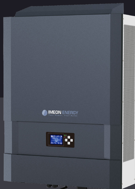
IMEON 9.12 bis zu 12kWp dreiphasig

IMEON Smart Grid-Wechselrichter bieten die Komplettlösung für ein effizientes Management multipler Energiequellen. Die eigene Solarenergie direkt verbrauchen, sie zur späteren Verwendung oder für Netzausfälle in Batterien speichern, Energie in das Netz einspeisen oder, nur falls nötig, aus dem Netz beziehen – das alles ist jetzt möglich. Neueste französische Forschungs- und Entwicklungsarbeiten haben zu dieser intelligenten Energiemanagementlösung geführt, die endlich eine wirkliche Kontrolle der eigenen Energienutzung möglich macht.