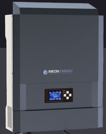
IMEON 3.6 bis zu 4kWp monphasig